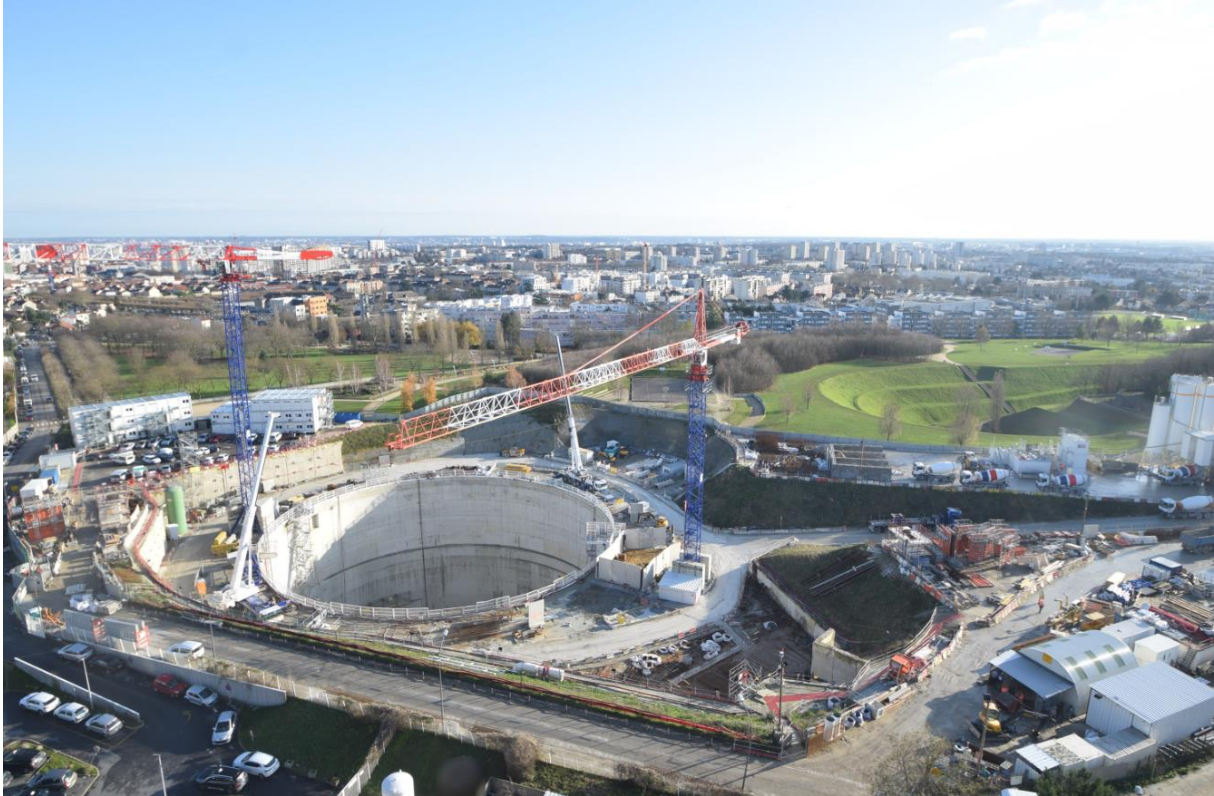
Chantier de la future gare de Villejuif IGR

Au programme de cet événement : un spectacle pyrotechnique créé par Groupe F, une mise en lumière artistique du puits, un live musical de Jaffna, une installation de l'artiste Iván Navarro et l'exposition « archéologie du futur » plongeront les participants dans une ambiance festive et artistique. Les plus jeunes profiteront également des ateliers jeunesse, sans oublier le traditionnel gigot bitume offert à tous !